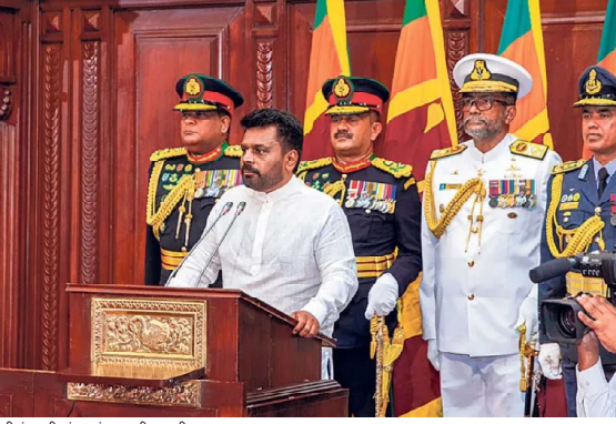
श्रीलंका की संसद भंग कर दी जाएगी। अब संसदीय चुनाव दिसंबर में होंगे। हालांकि, श्रीलंका में राष्ट्रपति, राज्य और संसद के कार्यकारी राष्ट्रपति प्रणाली के कारण, दिसानायक को सारी चीजों को सुचारु रूप से चलाने के लिए सांसदों के समर्थन की आवश्यकता होगी। श्रीलंका की 225 सदस्यीय मंत्रिमंडल संसद में अनुरा कुमारा दिसानायक की पार्टी के केवल तीन सांसद हैं। दक्षिणपूर्वी श्रीलंका पौदुजना परेम्ना के पास 225 सीटों में से 145 सीटों के साथ संसद में बहुमत होगा।

मंगलवार को नेशनल पीपुल्स पावर (एनपीपी) की सांसद डॉ. हरिनी अमरसुर्याय ने श्रीलंका के प्र प्र प्र नामंत्री के रूप में शपथ ली है। वह इस पद पर आसीन होने वाली 16वीं शक्तिशालि वन मर्दा डॉ. हरिनी अमरसुर्याय, शिक्षा, श्रम, उद्योग, विज्ञान एवं प्रौद्योगिकी, स्वास्थ्य और निर्माण मंत्री के पोर्टफोलियो भी सम्भालेंगी। लेकिन यह सुनाई बोझ अजीब लगना, कि प्रधानमंत्री के पद की शपथ लेने के चंद घंटों बाद