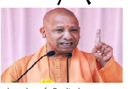
प्रदेश के कई जिलों से पाइपलाइन विधानों के बावजूद जारी रहने के लिए विभागों को देखते हुए आज प्रारंभिक

लखनऊ (आभा)। युगी में हर घर नल से जल योजना में लापरवाही पर युगी की योगी सरकार सख्त हो गई है। पाइपलाइन विधानों के लिए काटी गई सड़कों की मरम्मत न करने वाले और नल कनेशन की गलत रिपोर्टिंग करने वाली जेजियों के खिलाफ ब्लेकलिस्टिंग और कॉन्ट्रैक्टर को जेल भेजा जाएगा। इसके साथ ही संबंधित अधिशासी अधिकारियों के खिलाफ कार्रवाई होगी।