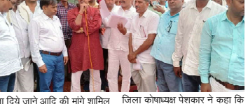
मत्ता दिये जाने आदि की मांगें शामिल हैं।