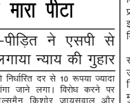
भारतीय बस्ती संवाददाता-बस्ती। शराब की दूकान पर नि:गतिरित दूकान से अधिक रूपया मंगाने पर हुये विवाद के दौरान सेल्समैन और उसके साथियों ने उपनोक्ता को मारा पीटा।