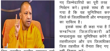
गए जिम्मेदारियों का पूरी तरह से निवेश करें। इसके साथ ही कहा गया है कि सम्बन्धित जिलाधिकारी और मण्डलाध्यक्ष का दायित्व है।

लखनऊ (आभा)। लोकसभा चुनाव के बाद से पूरी की योंगें सुकाव लानातार अलग लोगों की सम्पत्तियों और अधिकारियों पर नकेल कसने का काम रही है। इसी के तहत तहसीलदारों को एसडीएम को तहसील में ही निवास करने का आदेश सौंपा योंगें ने दिया है। तहसीलदार और एसडीएम तहसील में ही रहें वहाँ य नहीं इसकी जांच का निर्देश जिलाधिकारी और कमिश्नर को दिया गया है। मुख्य सचिव मनोम वाम सिंह की तरफ से इस बाबत आदेश जारी किया गया है।