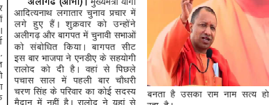
बनता है उसका राम नाम सत्य योगी