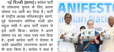
पर आचार्य हैं। कांग्रेस ने बुना न्याय के तहत जिन पांच गारंटी की बात की है उनमें 30 पाने संरक्षणी प्रकाशित हैं।