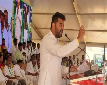
रेवन्ना पर आरोप क्या है। आरोप है कि सांसद रेवन्ना ने खुद ही अरलील वीडियो शूट करवाए थे। बता दें कि वीडियो वायरल होने के बाद रेवन्ना देश छोड़कर जर्मनी चले गए हैं।

नई दिल्ली (आभा)। पूर्व प्रानमंत्री और जेडीएफ सुप्रीमो एकट्टी देवगौड़ा का परिवार यान उद्योजक के मामले में फंस गया है। देवगौड़ा के सांसद पोते प्रज्वल रेवन्ना को तो देश ही छोड़ना पड़ गया। देवगौड़ा के परिवार की ही कुक ने देवगौड़ा के विधायक बेटे एकट्टी देवगौड़ा को तो प्रज्वल रेवन्ना के खिलाफ यान शोषण का मामला दर्ज कराया है। रेवन्ना का वीडियो भी अरलील वीडियो वायरल हुआ था जिसमें वह कई महिलाओं का यान उद्योजन करते दिखाई दे रहे हैं। इस मामले में प्रज्वल रेवन्ना का कहना है कि सारे वीडियो फर्जी हैं और उसीके परिवार को बदनाम करने की साजिश है।