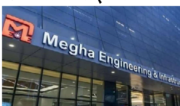
मेधा इंजीनियरिंग एंड इंफ्रास्ट्रक्चर लिमिटेड का मुख्यालय।

नई दिल्ली (आभा)। इस्पात मंत्रालय तथा मेधा इंजीनियरिंग इंफ्रास्ट्रक्चर लिमिटेड के अधिकारियों पर 315 करोड़ रुपये की एनआईएसपी परियोजना में कथित भ्रष्टाचार को लेकर मामला दर्ज किया गया है। केंद्रीय अन्वेषण द्यूरो (सीबीआई) ने शनिवार को ये जानकारी दी। जांच एजेंसी ने बताया कि इसने 315 करोड़ रुपये की परियोजना के क्रियान्वयन में कथित भ्रष्टाचार को लेकर इस्पात मंत्रालय के एनएमडीसी आयरन एंड स्टील प्लांट के आठ अधिकारियों सहित मेधा इंजीनियरिंग एंड इंफ्रास्ट्रक्चर लिमिटेड के खिलाफ मामला दर्ज किया है।